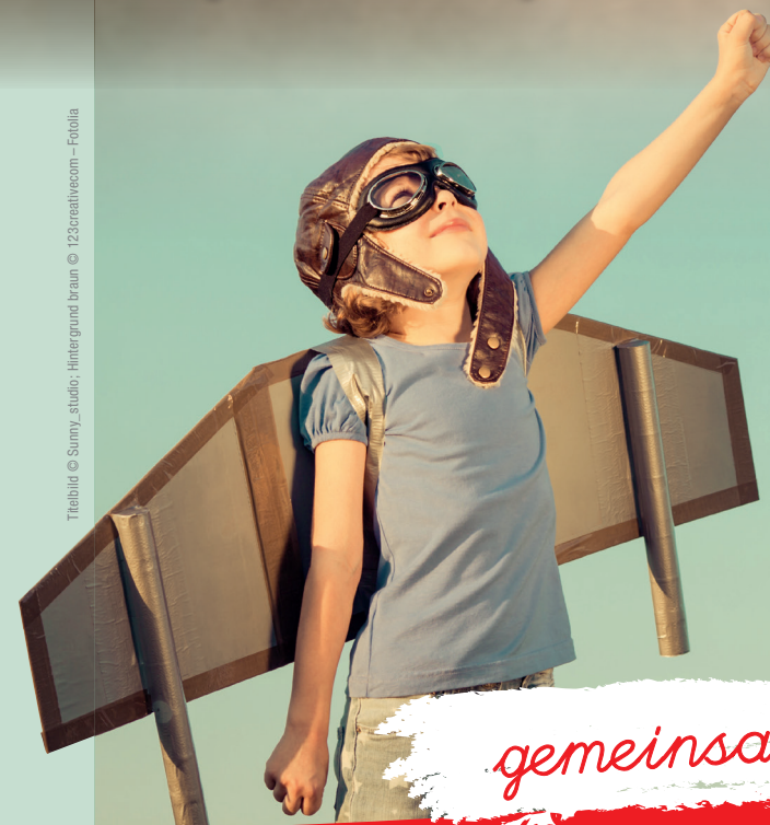
Titelbild © Sunny_studio; Hintergrund braun © 123creativecom – Fotolia